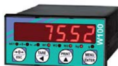
W100 Bilancia B (Scale)