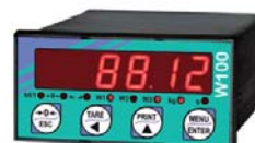
W100 Bilancia C (Scale)

Il WRBIL è stato progettato con l'intento di risolvere le problematiche di pesatura legate ad impianti di dosaggio che necessitano sino a 3 bilance inserite sulla stessa linea di produzione.