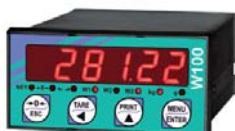
W100 Bilancia A (Scale)